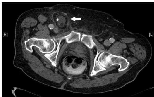
Figura 1 – Corte axial de TC en el que se identifica una hernia femoral incarcerada en la región femoral derecha con líquido libre y un apendicolito en el interior del saco herniario.

Presentamos el caso de un varón de 82 años que acudió a Urgencias por un cuadro de dolor abdominal de cinco días de evolución asociado a una masa dolorosa en región femoral derecha. En la exploración física, el paciente se encontraba estable hemodinámicamente. El abdomen era blando y depresible, y no presentaba defensa abdominal ni signos de irritación peritoneal. En la región femoral derecha, medial a la arteria femoral e inferior al ligamento inguinal, se palpaba una masa dura, dolorosa y eritematosa, que no era reductible con maniobras de taxis. Analíticamente, destacaba leucocitosis con neutrofilia. Se realizó un TC abdominal urgente para confirmar el diagnóstico de hernia femoral incarcerada y poder determinar su contenido. El TC puso de manifiesto una hernia femoral con una apendicitis aguda y líquido libre en el interior del saco herniario (fig. 1). Se decidió intervención quirúrgica urgente. Se abordó la región femoral a través de una incisión de Lockwood (incisión vertical supratumoral desde pliegue inguinal a muslo) 3 , lo que puso de manifiesto una hernia femoral incarcerada que presentaba en el interior del saco herniario abundante líquido libre de aspecto purulento y una apendicitis aguda perforada con un apendicolito en su luz (figs. 2 y 3). No se pudo