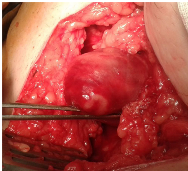
Figura 2 – Hernia femoral incarcerada.

alcanzar el ciego a través del orificio femoral, por lo que decidimos realizar la apendicectomía a través de una incisión de McBurney. El defecto herniario en región femoral se reparó mediante herniorrafia, con sutura del ligamento inguinal al ligamento de Cooper. La evolución posoperatoria fue favorable, y el paciente fue dado de alta al quinto día de la intervención.