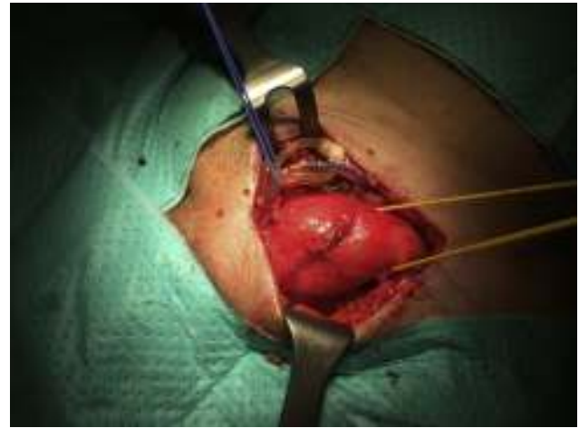
Figura 4 – Cordón espermático referenciado con hilo amarillo con hernia inguinal indirecta.