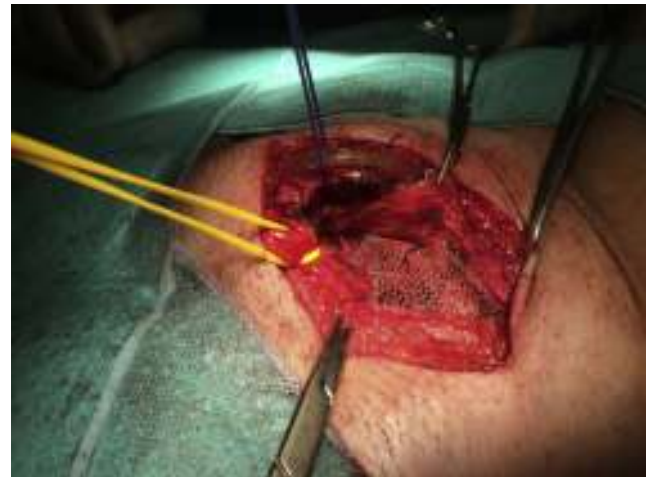
Figura 5 – Malla de polipropileno situada debajo de la aponeurosis del músculo oblicuo mayor.