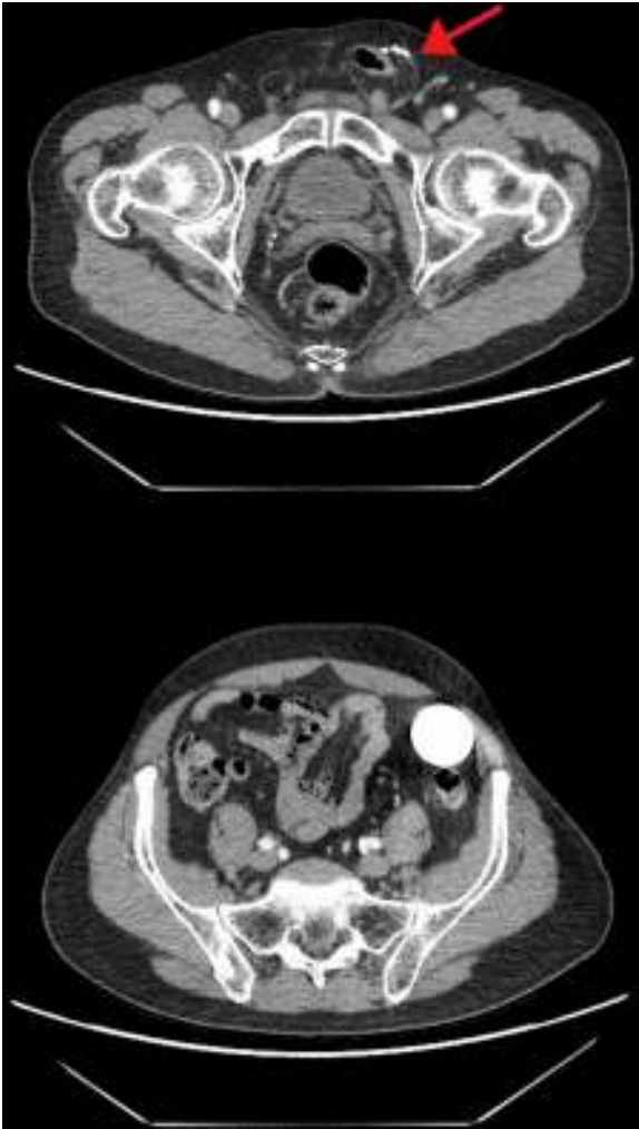
Figura 2 – Tomografía computarizada abdominal (corte axial): Arriba: se observan los dispositivos del sistema junto al saco herniario inguinal izquierdo (flecha). Abajo: Balón-reservorio en fosa ilíaca izquierda.