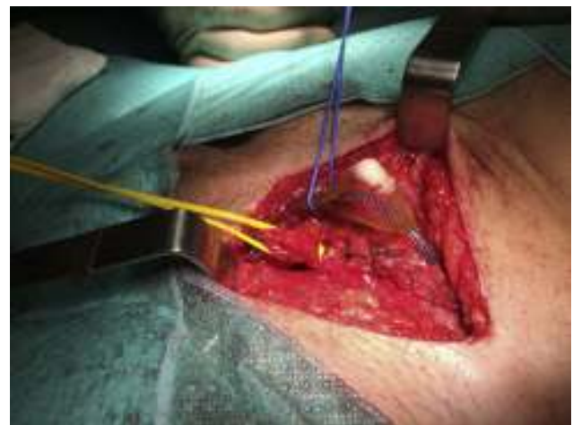
Figura 6 – Resultado final con la aponeurosis del músculo oblicuo mayor suturada.