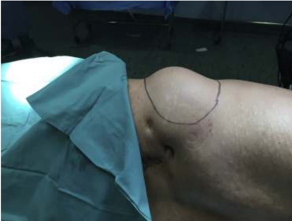
Figura 2 - Tumoración en la región lumbar izquierda.