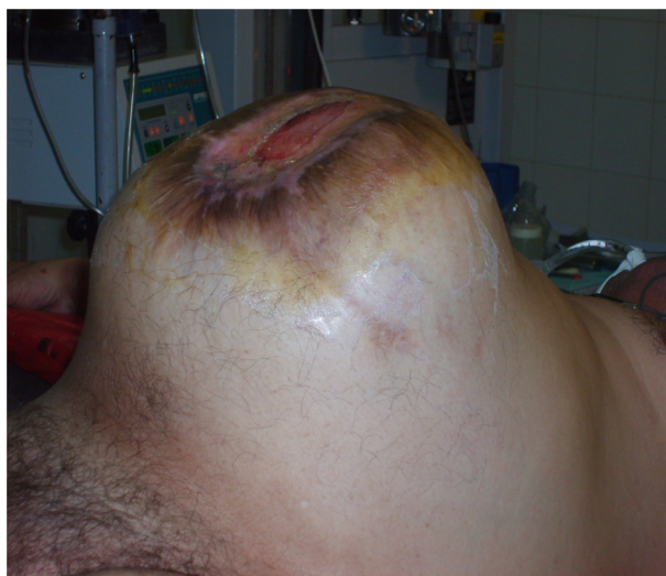
Figura 1 – Gran distensión abdominal. Lesiones tróficas en la cicatriz quirúrgica.

Se le colocó una sonda nasogástrica, por la que drenó un escaso débito bilioso. El examen físico, dificultoso por estar el paciente en coma, reveló un gran defecto abdominal sobre la línea media, con úlceras tróficas de la cicatriz. Timpanismo generalizado y ruidos hidroaéreos escasos no propulsivos.