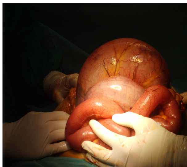
Figura 3 – Hallazgo intraoperatorio: vólvulo sigmoideo con necrosis y perforación bloqueada. Perforación cecal por síndrome de asa cerrada.

Anatomía patológica: dolicomegacolon con infarto transmural localizado en ciego e ileoterminal con inflamación