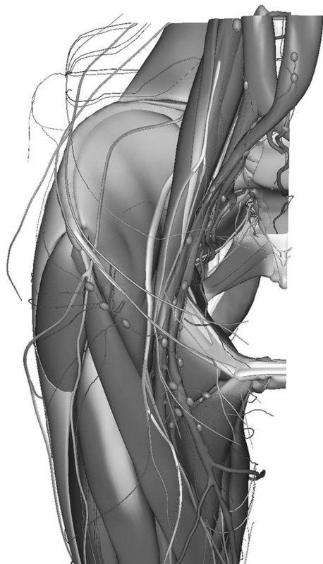
Figura 1 – Esquema de la distribución del nervio femorocutáneo lateral (Primal Interactive Hip; edición de 2013, en www.primalpictures.com ). El nervio femorocutáneo aparece más brillante y en la zona externa de la figura.

habitual para tratar la hernia inguinal por laparoscopia totalmente extraperitoneal, mediante trocar balón de distensión y trocres auxiliares de trabajo sobre la línea media (2 de 5 mm). Se explora el espacio inguinal y se accede al anillo inguinal interno, donde se visualiza la malla implantada. Primero se localiza el nervio genitofemoral, que se visualiza paralelo y lateral a los vasos ilíacos, sobre el músculo psoas, hasta alcanzar el anillo inguinal interno, donde es atrapado en una zona de fibrosis. Antes de proceder a su sección, se disecciona todo su trayecto y después se extrae un segmento de 3-4 cm para estudio histológico. Después se localiza el NFCL sobre el músculo ilíaco, se disecciona su trayecto desde el ligamento inguinal hasta el borde lateral del psoas y se reseca (fig. 2) (en ambos casos, la histología confirma fibras nerviosas). Se retiran los trocres bajo visión directa y se concluye la intervención.