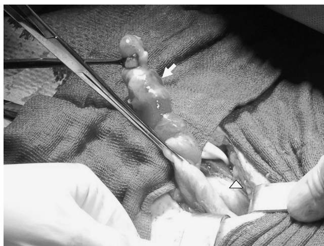
Figura 3 – Apendicitis aguda perforada (flecha blanca) asociada en hernia inguinal indirecta encarcelada (punta de flecha).

favorablemente, manteniendo antibioticoterapia durante 24 h, y fue dado de alta a las 48 h de la intervención sin tratamiento antibiótico. Transcurridos 10 meses de la intervención, tras ser valorado en consultas externas, el paciente se encuentra asintomático, sin complicaciones ni datos de recidiva herniaria.