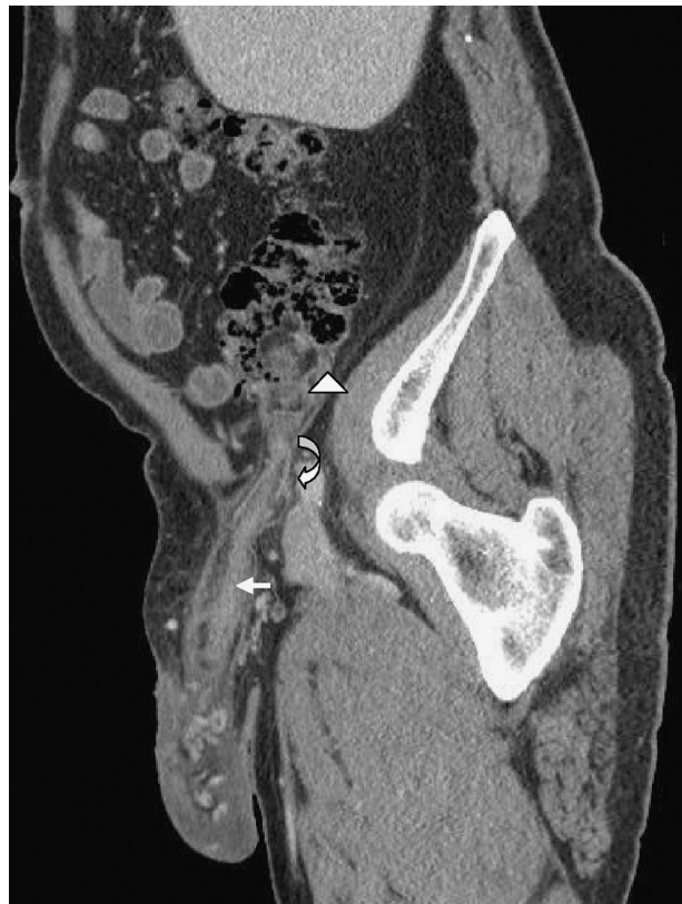
Figura 2 – Tac abdominopélvico: apéndice (flecha blanca) originado en la región cecal (punta de flecha) que sigue el conducto inguinal derecho (flecha curva) y llega hasta la bolsa escrotal derecha.

favorablemente, manteniendo antibioticoterapia durante 24 h, y fue dado de alta a las 48 h de la intervención sin tratamiento antibiótico. Transcurridos 10 meses de la intervención, tras ser valorado en consultas externas, el paciente se encuentra asintomático, sin complicaciones ni datos de recidiva herniaria.