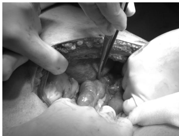
Figura 4 – Detalle operatorio del orificio herniario diafrágico con colon transverso incarcerated.

Ante los hallazgos clínicos y radiológicos, se decidió realizar una intervención quirúrgica urgente bajo anestesia general, con lo que se objetivó una hernia diafrágica de localización posterolateral izquierda con contenido de epiplón mayor y parte del colon transverso (fig. 4), lo que ocasionaba un cuadro obstructivo con dilatación del colon derecho y transverso y dilatación de asas de intestino delgado por