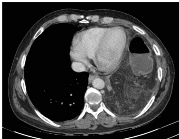
Figura 3 – TAC torácica con ocupación del hemidiafragma izquierdo por colon transverso y epiplón mayor.

delgado. También reveló lesiones focales hepáticas en los segmentos 4B de 33 mm y 7 de 10 mm, compatibles con hemangiomas, y una pequeña cantidad de líquido libre intraperitoneal, así como hipoplasia pulmonar izquierda.