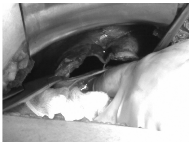
Figura 5 – Detalle operatorio del orificio herniario diafrágico.

En 1848, Vincent Alexander Bochdaleck describió por primera vez la hernia diafrágica, que acontece a través de un defecto posterolateral. En 1902, Haidenheim practicó la primera intervención con éxito en un niño de 9 años 1 . Este tipo