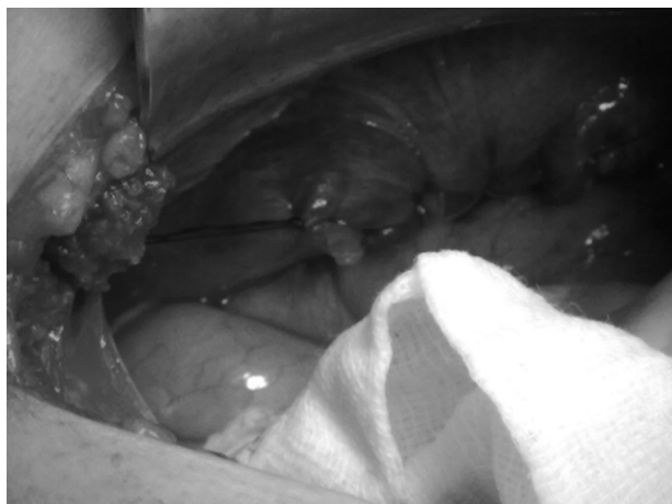
Figura 6 – Detalle operatorio del cierre del orificio herniario con sutura continua de polipropileno 0.

de hernia es un defecto congénito del diafragma, localizado en la inserción posterior, debido a la interferencia en el desarrollo del diafragma por falta de cierre del espacio pleuropéritoneal, y se puede dar por dos circunstancias: 1) porque el diafragma no se desarrolla completamente antes de que el intestino regrese al abdomen desde el saco vitelino en las semanas 8-10, o 2) porque el intestino regresa al compartimento abdominal tempranamente en la vida fetal. Si la iniciación de la hernia es anterior al desarrollo del pulmón, este es hipoplásico y su compromiso es severo. Si es posterior a su desarrollo, la hipoplasia es de menor grado o no existe 2 . La incidencia en recién nacidos oscila de 1:2 000 a 1:5 000 3 , mientras que es excepcional en el adulto (no sobrepasa el 10% 4 ).