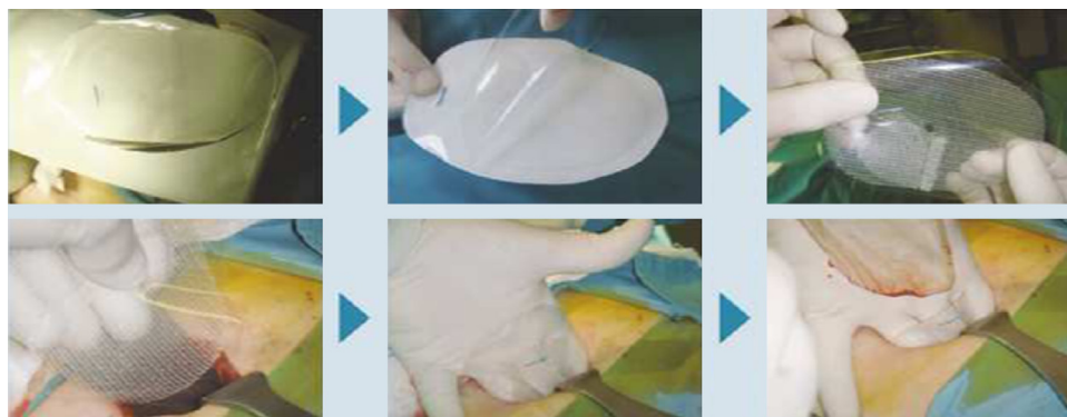
Figura 1 – Pasos para el manejo y colocación de la prótesis Parietene Progrid® de Covidien por la vía posterior preperitoneal abierta con nuestra modificación personal a la técnica de Nyhus.

preperitoneal, justo por encima de los vasos ilíacos y de la cintilla iliopúbica de Thomson. Se explora el conducto inguinal, liberando simultáneamente el cordón espermático y separándolo del saco herniario y del probable lipoma.