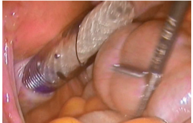
Figura 3 – Entrada de la prótesis por el canal vaginal protegido con trocar enfundado.