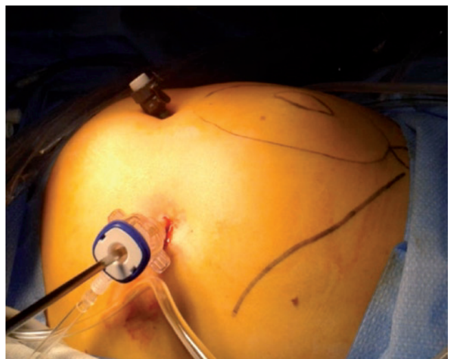
Figura 4 – Abordaje parietal con dos puertas de 3 y 5 mm.