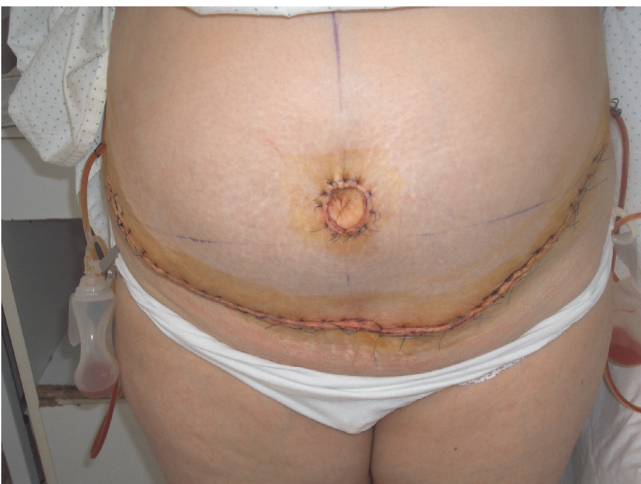
Figura 3 – Resultado final tras dermolipectomía y reconstrucción de la cicatriz umbilical.

diva no se ha reintervenido por deseo expreso del paciente, al encontrarse asintomático.