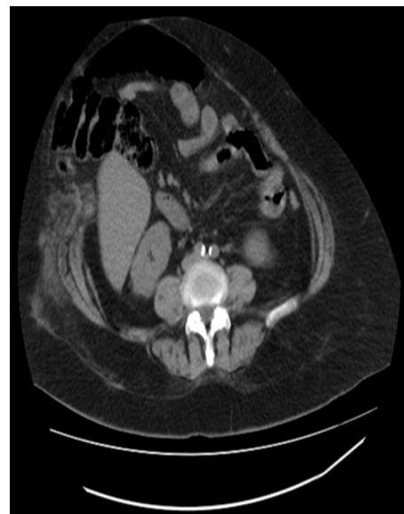
Figura 3 – Tac. Aire libre interasas.

Se decide abordar por incisión lateral sobre la tumoración eventrógena. La apertura permite una salida abundante de gas y una copiosa secreción saniosa fétida y purulenta. Una fascitis necrosante compromete ambas fascias del tejido celular subcutáneo, con el saco eventrógeno totalmente esfacelado. Después del lavado profuso y la extirpación de tejidos desvitalizados, se constata la presencia de un coprolito libre (que se