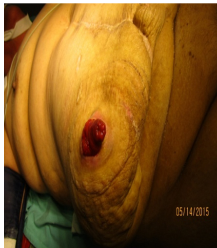
Figura 6 – Defecto periostómico y prolapso ileal.

consecuencia, habría una mayor necesidad de operaciones abdominales 2 .