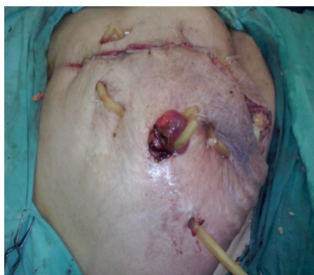
Figura 5 – Ileostomía y cierre capitoneado.

En la década de los setenta, Donal Kozoll consideraba que las eventraciones serían un problema cada vez más frecuente, debido al incremento de la población añosa y que, como