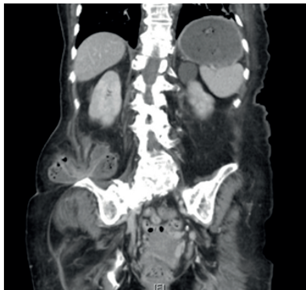
Figura 1. Corte coronal de TC en el que se objetiva una hernia de Petit derecha complicada.

La región lumbar presenta dos zonas delimitadas de debilidad y definidas en un triángulo superior y en otro inferior 4 . Jean Louis Petit fue el primero en describir los límites anatómicos del espacio lumbar inferior en 1783 mediante la descripción del caso de una hernia lumbar incarcerada en una mujer 2,5 . Se trata de una entidad infrecuente dentro de la patología herniaria y existe una limitada casuística en la literatura. Por ello, pese a que en algunas publicaciones se habla de una mayor tendencia según la localización y el sexo (predominio del lado izquierdo y en varones) 6,7,8 , es difícil aseverar dichas afirmaciones debido a la ausencia de largas series de casos 9 .