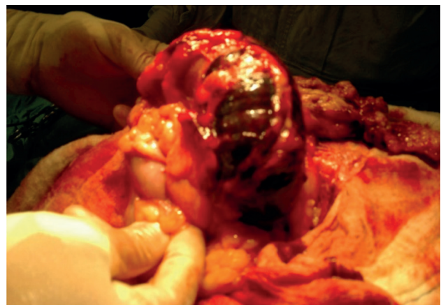
Figura 2. Segmento de 20 cm de colon transverso completamente necrosado, con la mayor parte del epiplón mayor.