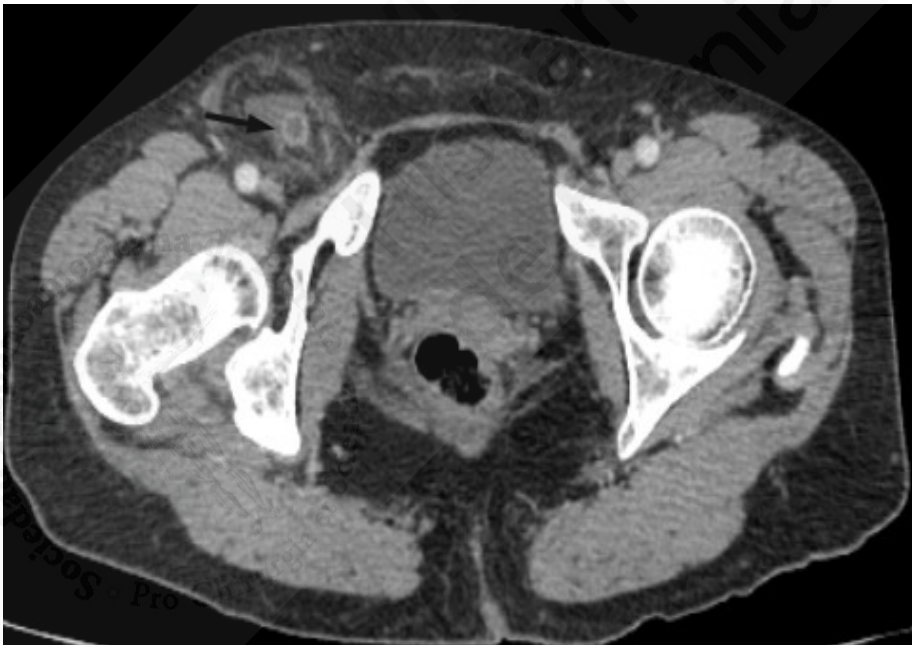
Figuras 1 y 2. Tomografía. Se identifica el apéndice cecal en el canal inguinal. Flecha negra: apéndice en el canal inguinal.