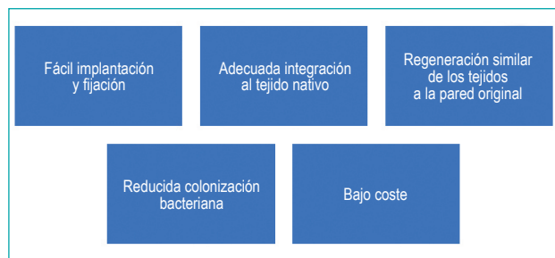
Figura 2. Características esperadas de una prótesis umbilical.

Los efectos secundarios y los eventos adversos asociados a la instalación de una prótesis en una cirugía de la hernia ventral (la hernia umbilical es una hernia ventral de menor tamaño) son mayores que en una técnica sin malla y están dados por la presencia de seroma, la infección del sitio operatorio y la posibilidad de una respuesta inflamatoria crónica (granuloma). Por lo anterior, los cirujanos deben conocer las características, las indicaciones y las interacciones del material de fijación y de la pared abdominal para disminuir o evitar su incidencia 14,15 .