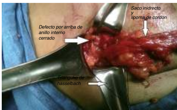
Figura 3 – Cierre del orificio herniario.

Dado lo inusual de esta dolencia, lo complejo del área inguinal y los pocos casos reportados, existe confusión a la hora de clasificar este tipo de hernias. Según Ficai et al., las hernias periinguinales se consideran una variante de las hernias de