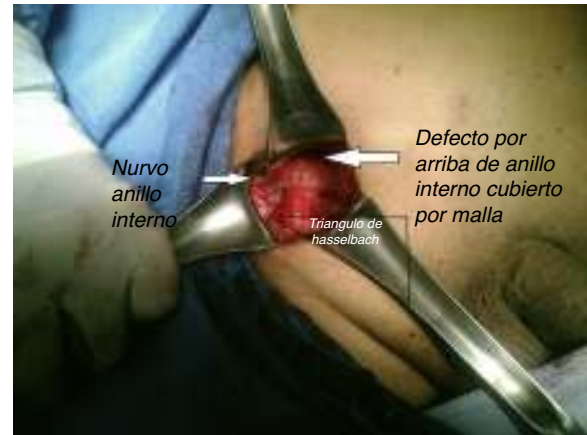
Figura 4 – Fijación mediante la técnica de Lichtenstein.

Spiegel bajas 4 ; sin embargo, estas entidades patológicas deben ser distinguidas, dada su diferencia anatómicoquirúrgica.