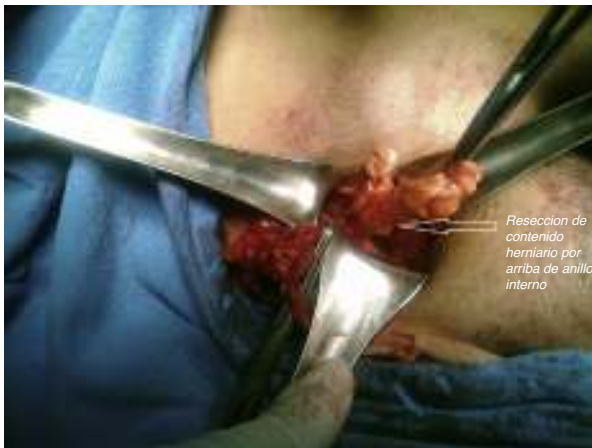
Figura 2 – Resección del saco con ligadura.

alta mediante poliglecaprone 2-0 y cierre del orificio herniario de forma transversa, con sutura continua mediante poliglecaprone 2-0 (fig. 3). Se exploró el cordón espermático, donde se observó defecto indirecto concomitante, con saco de 7.5 × 2 cm y lipoma del cordón espermático (fig. 1), que se resecó, y se ligó el muñón con poliglecaprone 2-0. Se colocó una malla de polipropileno pesado de 15 × 7.5 cm, fijándola siguiendo los principios técnicos de Lichtenstein 12 , para cubrir la totalidad del defecto (fig. 4). Se le dio de alta a las 2 h del procedimiento, con citas continuas a los 7 días, un mes y 3 meses, hasta el año del posquirúrgico. Actualmente se encuentra asintomático y sin recidiva herniaria en la exploración física.