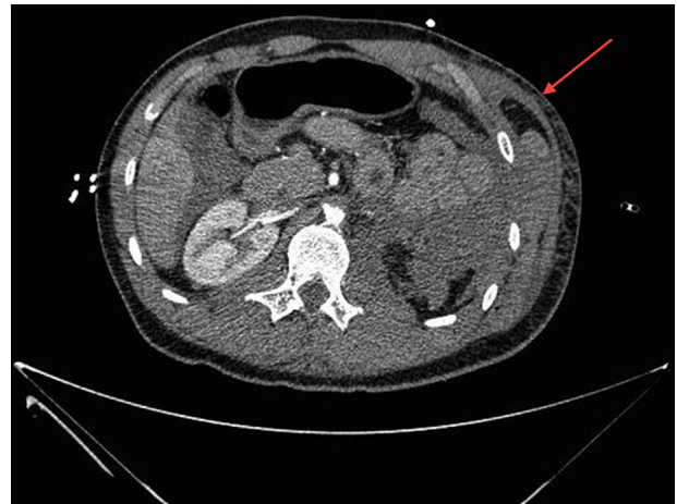
Figura 1 – TC abdominal (corte axial). Herniación de asas de intestino delgado a nivel del noveno espacio intercostal.

Al paciente se le realizó, bajo anestesia general, una laparotomía suprainfraumbilical que evidenció gran hemoperitoneo y