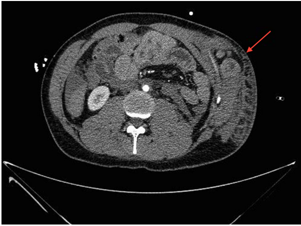
Figura 3 – TC abdominal (corte axial). Herniación de asas de intestino delgado que protruyen hasta el 11.º espacio intercostal. Hemoperitoneo.