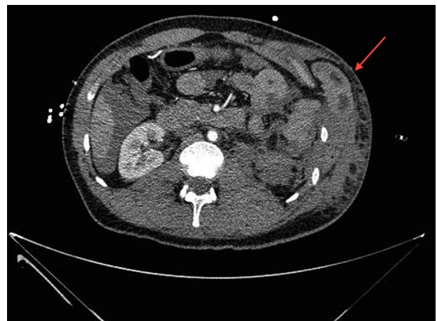
Figura 2 – TC abdominal (corte axial). Se observa el anillo herniario intercostal producido por el desgarro muscular, gran hematoma subcutáneo y traumatismo renal izquierdo.

gran herniación de asas de intestino delgado entre las costillas novena y décima. Se procedió a reducir el contenido herniario y se efectuó control vascular esplénico y renal, llevando a cabo esplenectomía y nefrectomía izquierda de urgencias. Se realizó una cuidadosa hemostasia de las laceraciones hepáticas. Una vez controlado el sangrado y revisada la cavidad para valorar daños, se procedió a realizar la reparación de la gran hernia intercostal. Se evidenció una rotura musculoponeurótica de